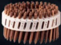
Verarbeitung mit LIGNOLOC-Holznägeln

...die belastbare Dübelholz decke mit Buchenholzdübeln