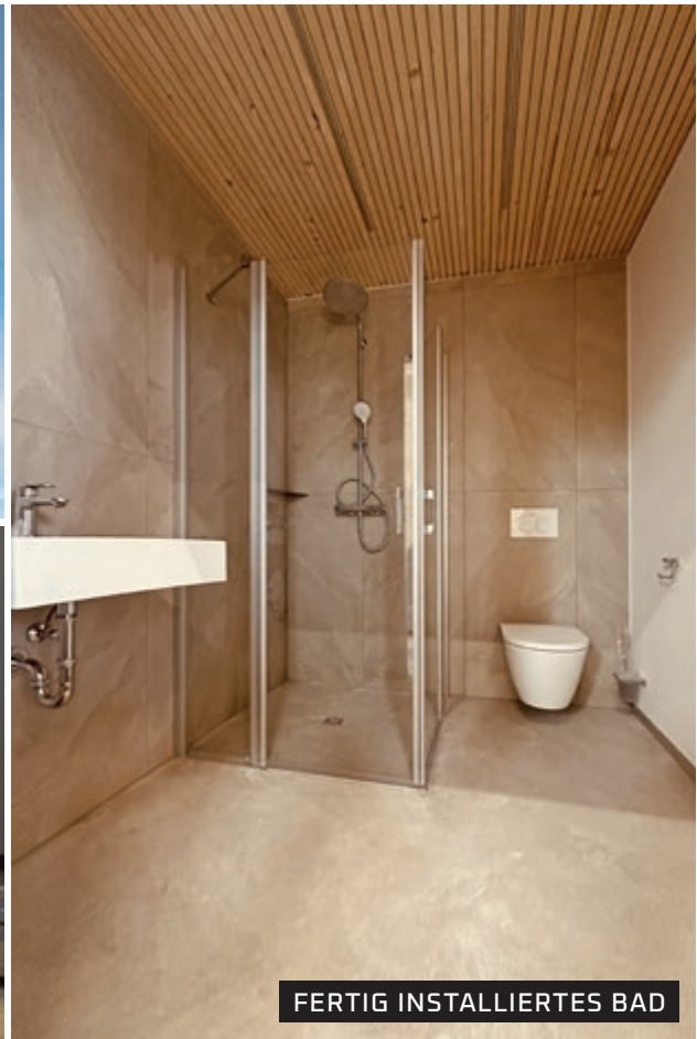
FERTIG INSTALLIERTES BAD

» Wenn das Bad schon fertig auf die Baustelle kommt. «